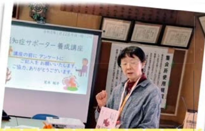
1/22 栄第二団地木曜会 講師：定永さん