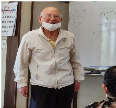
若桜会 第1回5月10日 *活動再開* 認知症予防講和と認知症予防体操

【桜木東校区 老人クラブ若桜会】 場所：花立ふれあい公園 老人憩いの家 奇数月 10日前後 10：00～11：00 (活動予定) 7/10 (月) 生活習慣病と栄養 9/11 (月) ひざ痛・腰痛 の予防体操