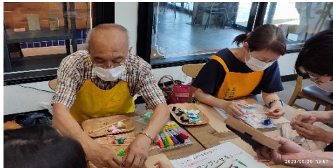
場所：TUTAYAさくらの森店 第2水曜日 10：00～11：00 (活動内容) 講話や体操等 第3日曜日 13：00～14：00 (活動内容) 元気高齢者の得意技でみんなで遊ぼう

協力ボランティア *エコ村伝承館* 5月20日 「ぶんぶんゴマ」 制作 セミの鳴き声のよう な音がでるぶんぶん ゴマ 来場のこどもたちと 楽しく制作しました