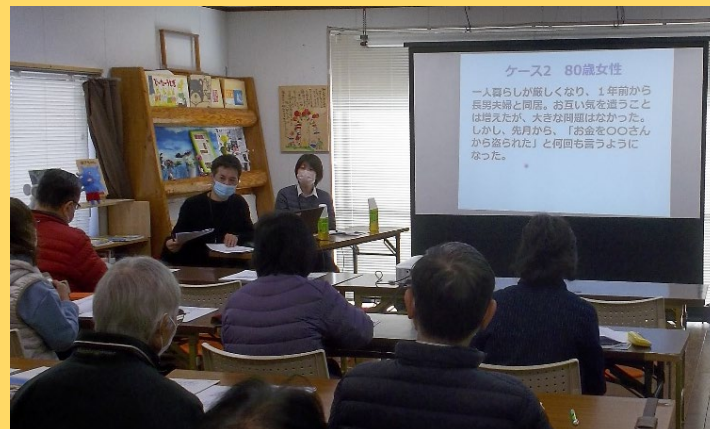
※写真は秋津레이크タウン自治会の様子

運動機能向上プログラムのほかにも、必要な方へは栄養改善プログラム等のご紹介も行います。基本チェックリスト該当の有無の確認やご相談など、お気軽にお問い合わせください。