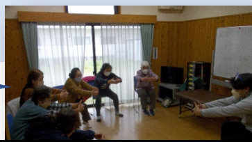
実際の体操の様子

日時：毎週 火曜 午後1時～2時 場所：うぐいすばる公園内 老人憩の家 定員：10名 対象者：桜木校区にお住いの方で、基本チェックリスト該当または要支援1・2の方。